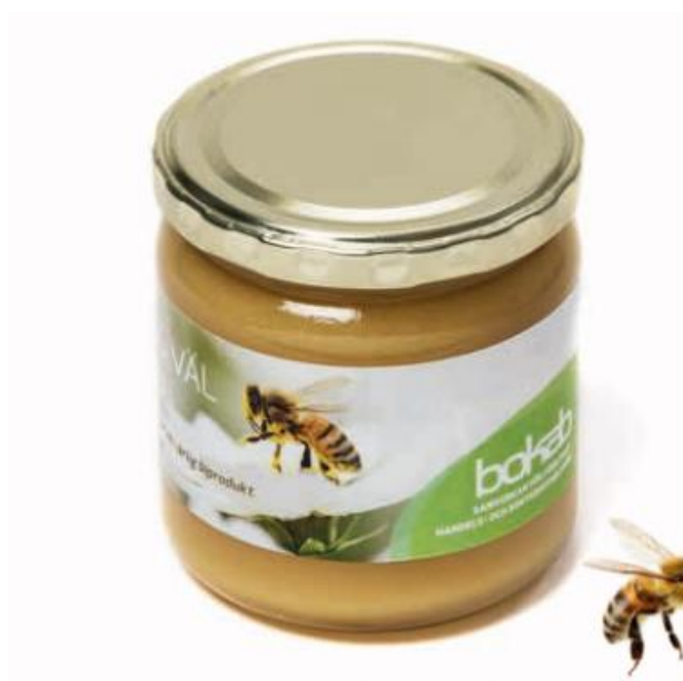
Bokab – flitiga som bin!